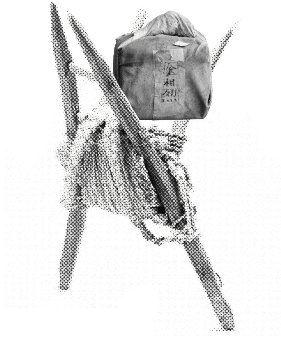
Flattening with Jigae and great great grandfather's body.